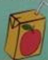
du jus de fruits