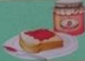
du pain à la confiture